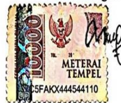
Ayu Rahayu Ningrum