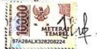
Apip Yafar Sodik