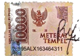
Rina Azzahra Fili