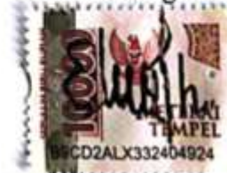
Endah Nurul Purwanti