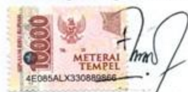
Muhamad Albar Sapin