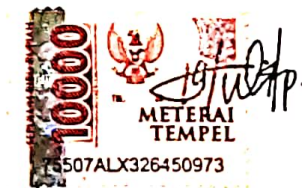
Yuli Dwi Pumaningsih